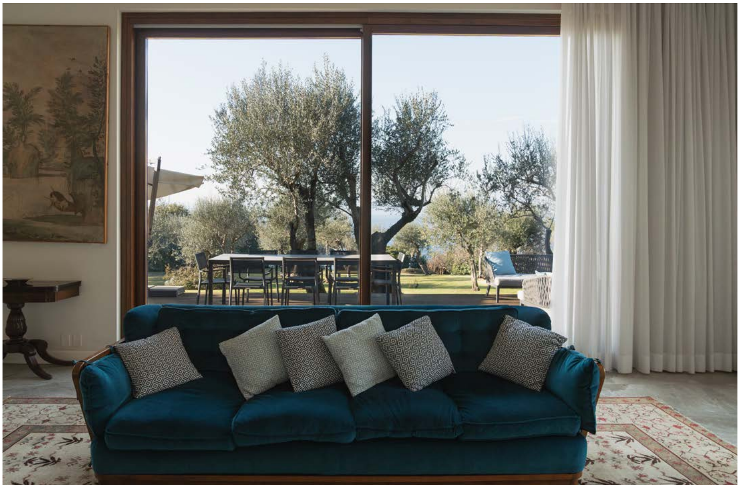
Le ampie vetrate assicurano luce naturale e una vista sul parco