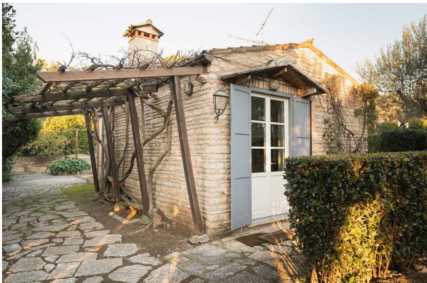
La dependance completamente ristrutturata