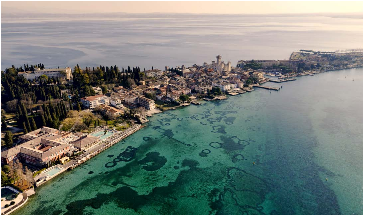
An aerial view of Sirmione