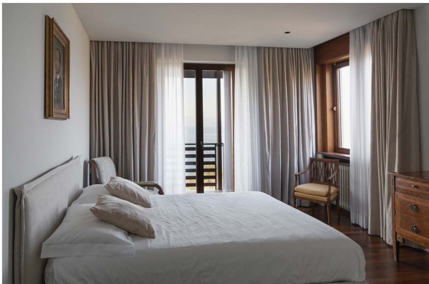
Il relax della camera padronale combinato alla vista sul lago