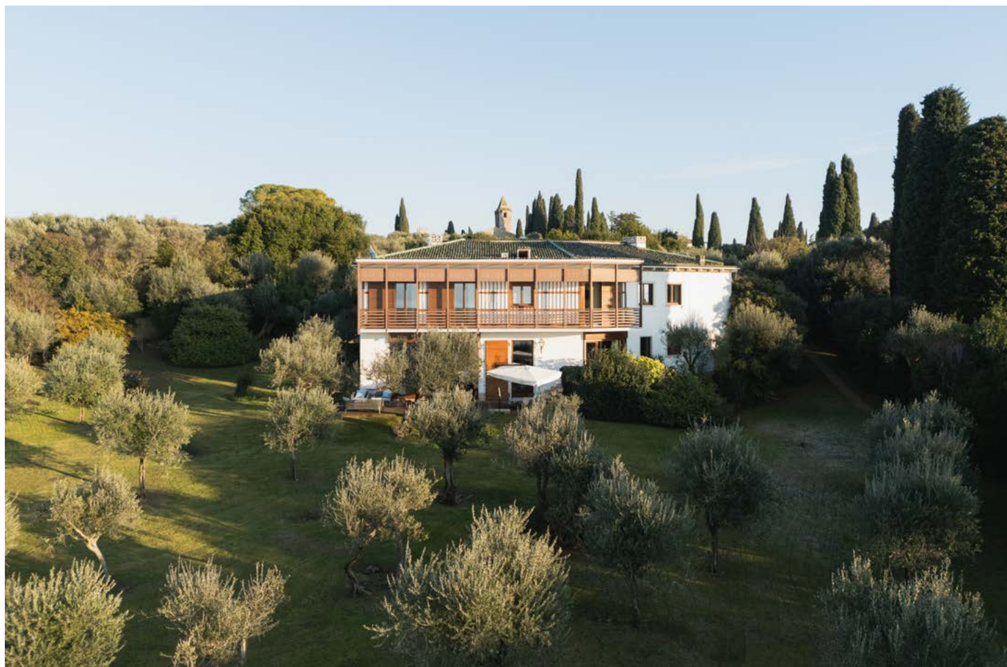
Veduta di insieme del corpo principale della proprietà