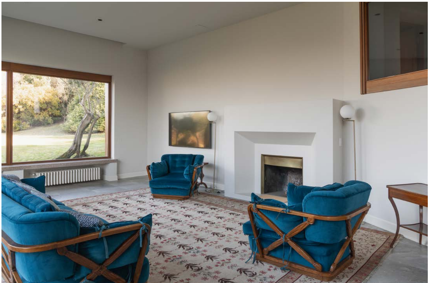
La sobria eleganza della zona living