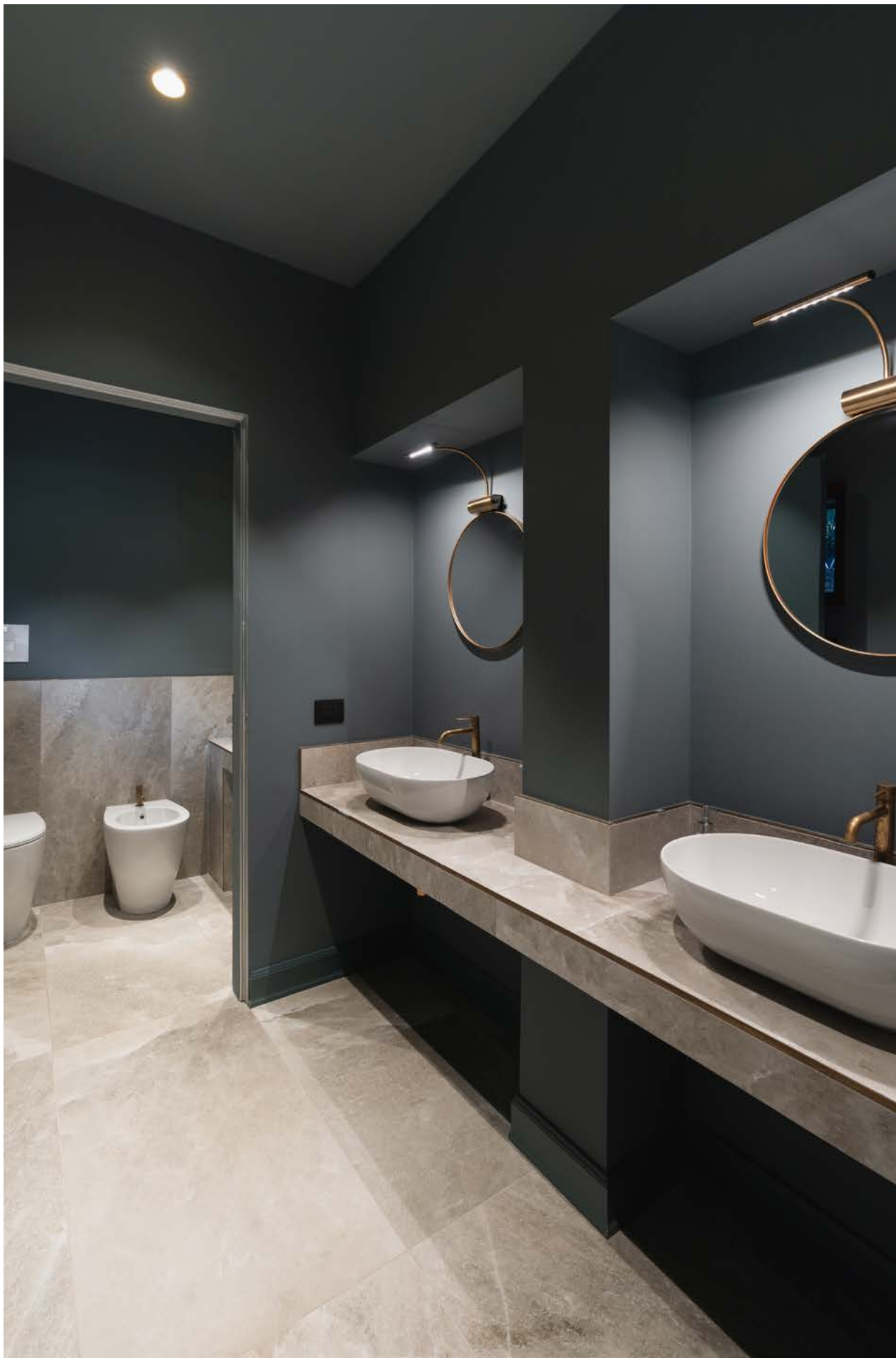
Dettagli di classe nel bagno al piano terra Classy details in the bathroom on the ground floor