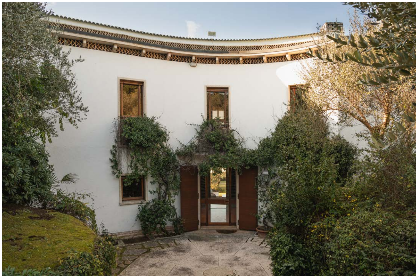
L'ingresso principale della villa