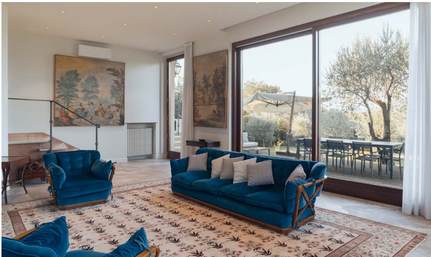
The living area on the ground floor with large windows