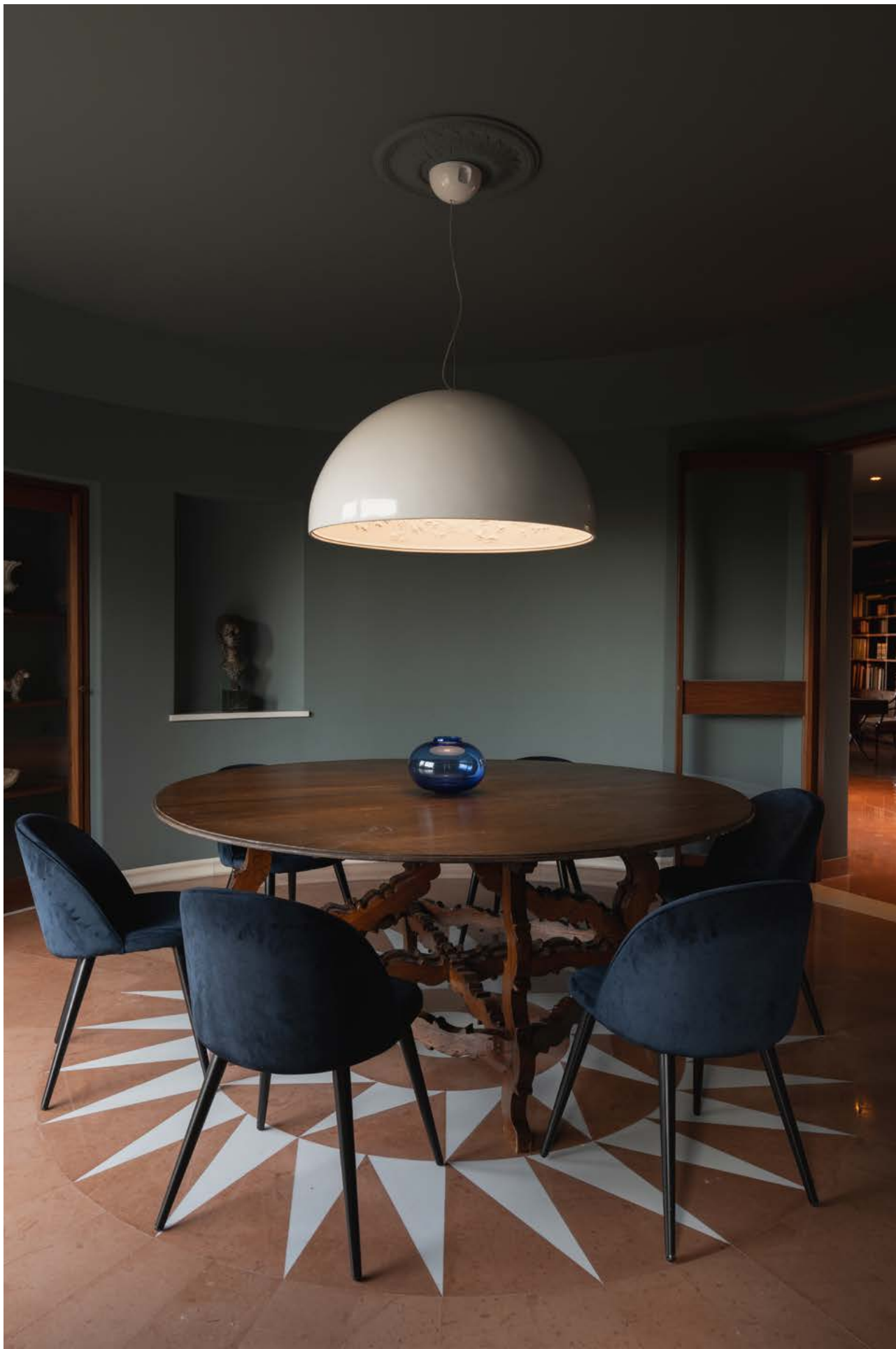
Eleganza e design si incontrano nella sala da pranzo Elegance and design meet in the dining room