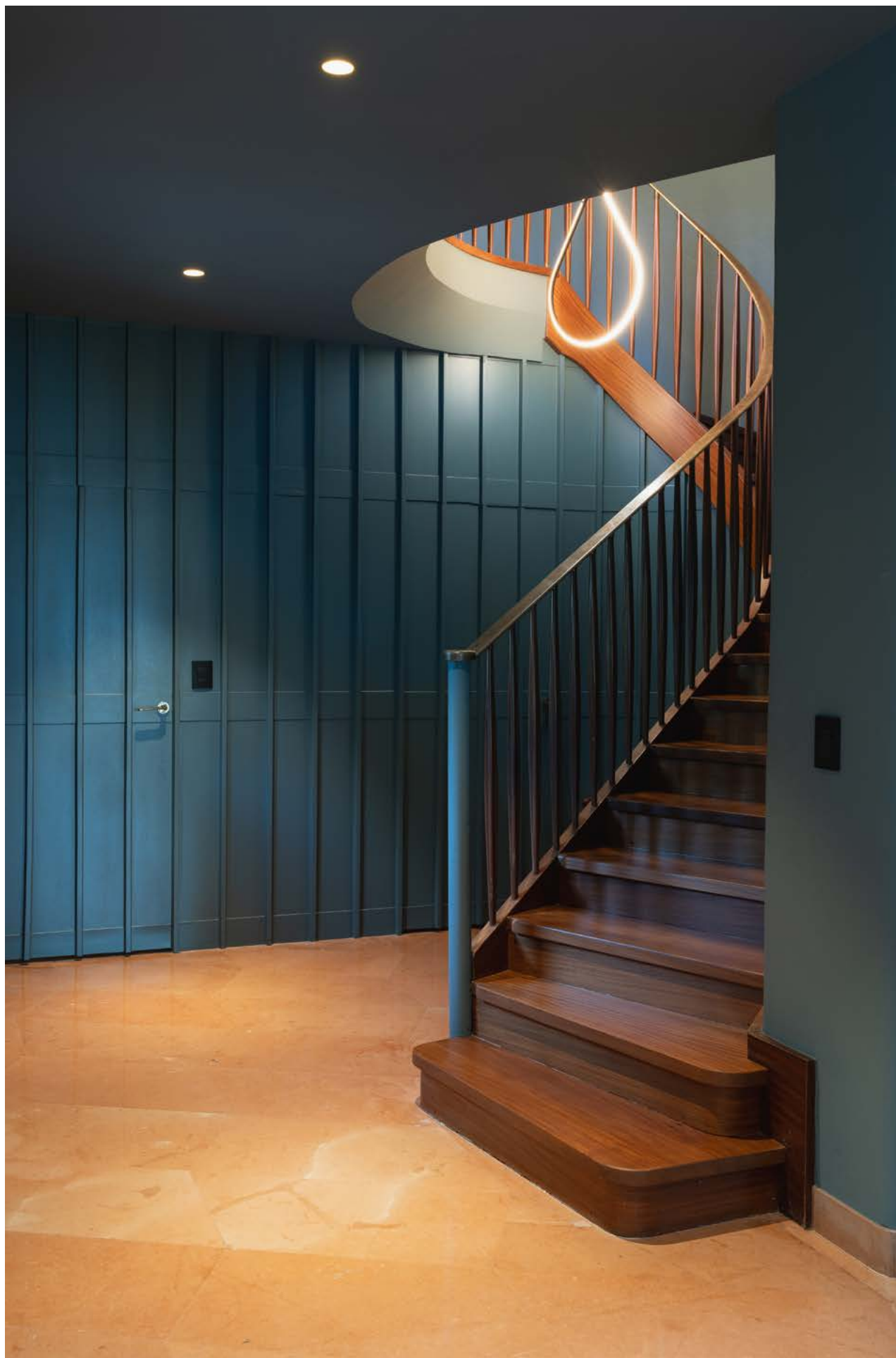
Linee armoniche e contemporanee nella scala che conduce al primo piano Harmonious and contemporary lines in the staircase leading to the first floor