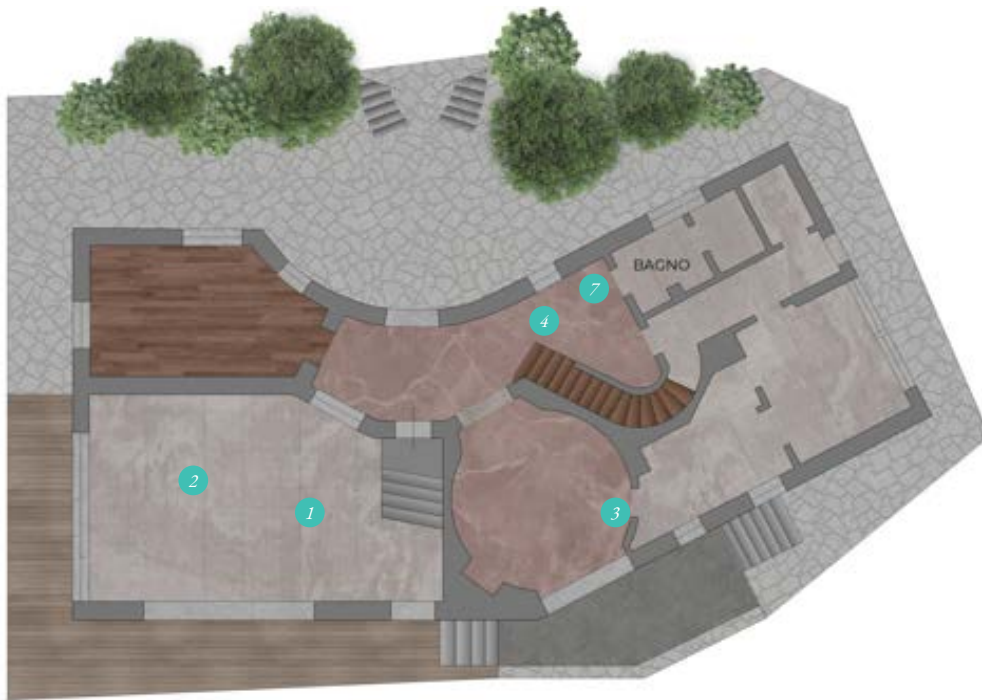
Piano Terra Ground floor