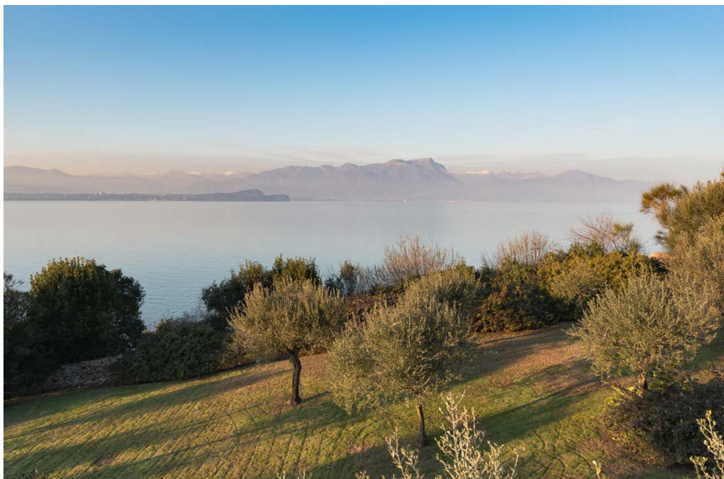
La vista sul lago della villa, un panorama senza pari