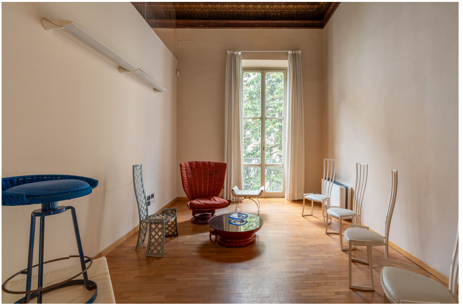
Nobiltà e genio creativo si fondono in questa residenza