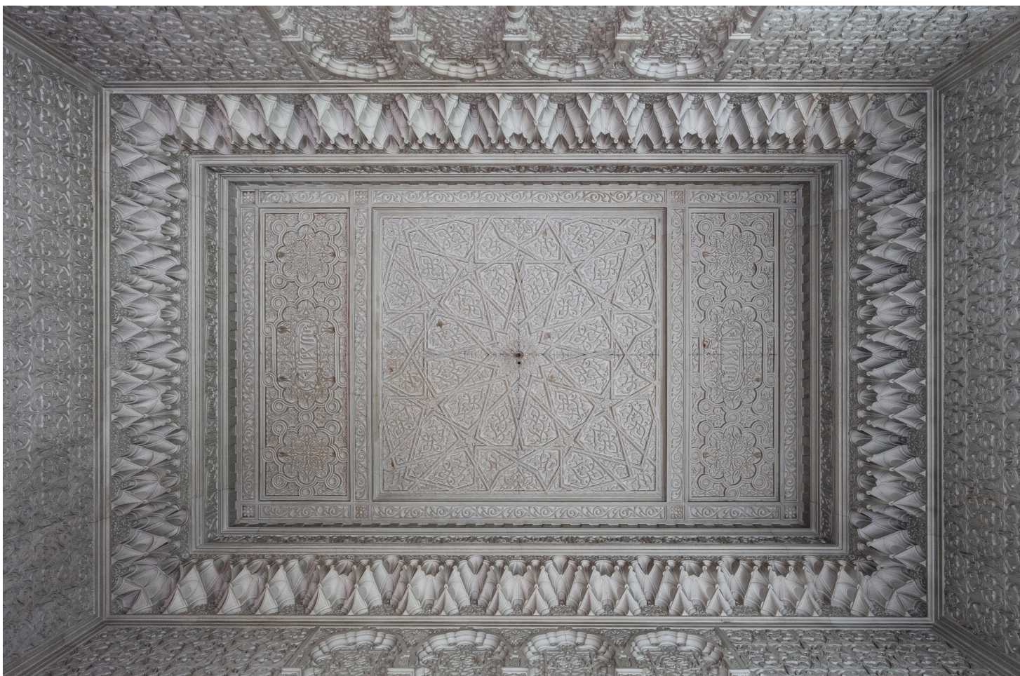
Un soffitto arabeggiante di straordinaria fattura si svela in tutta la sua complessità