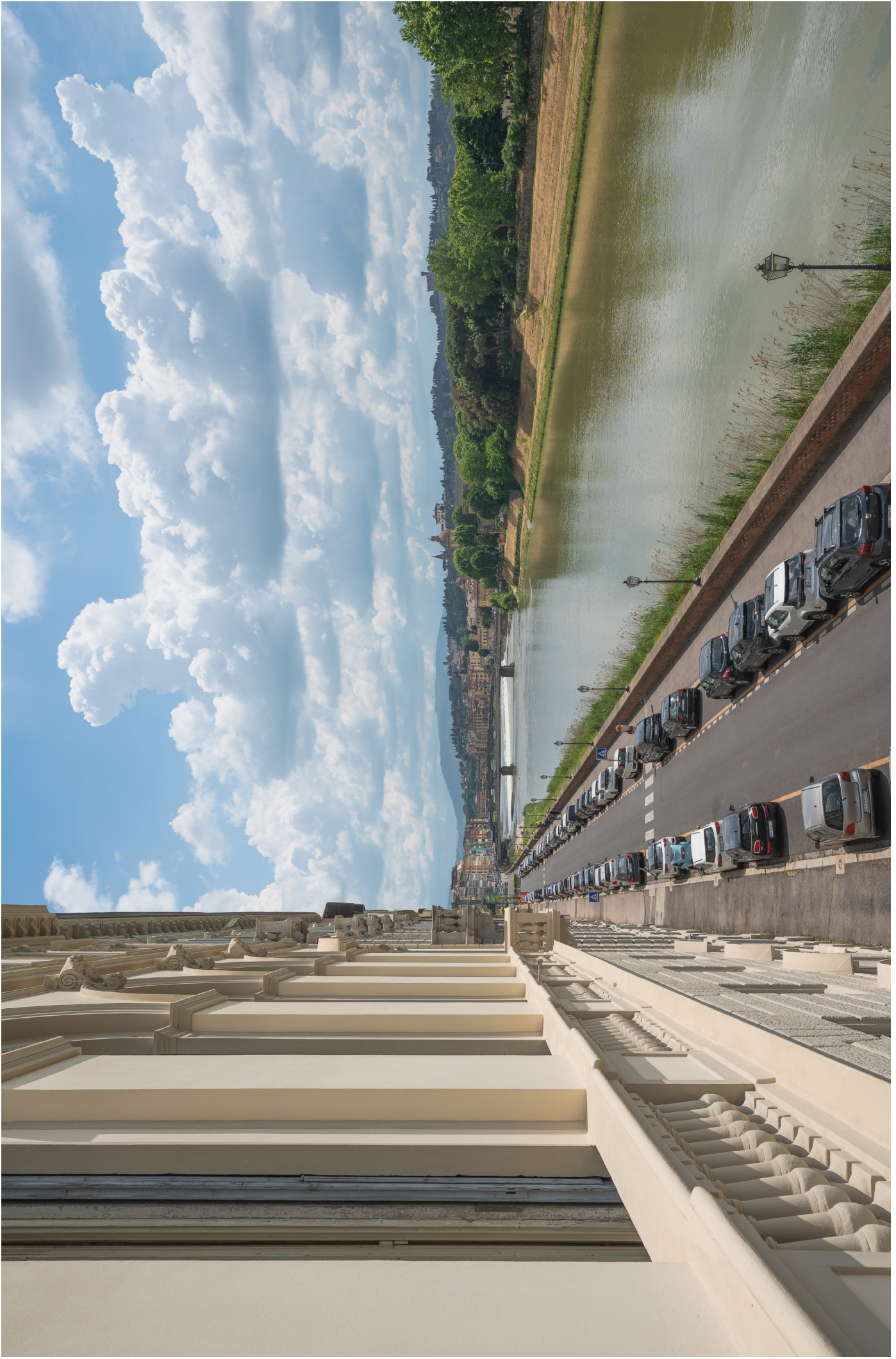
La veduta sul Lungarno Amerigo Vespucci

The view on the Lungarno Amerigo Vespucci