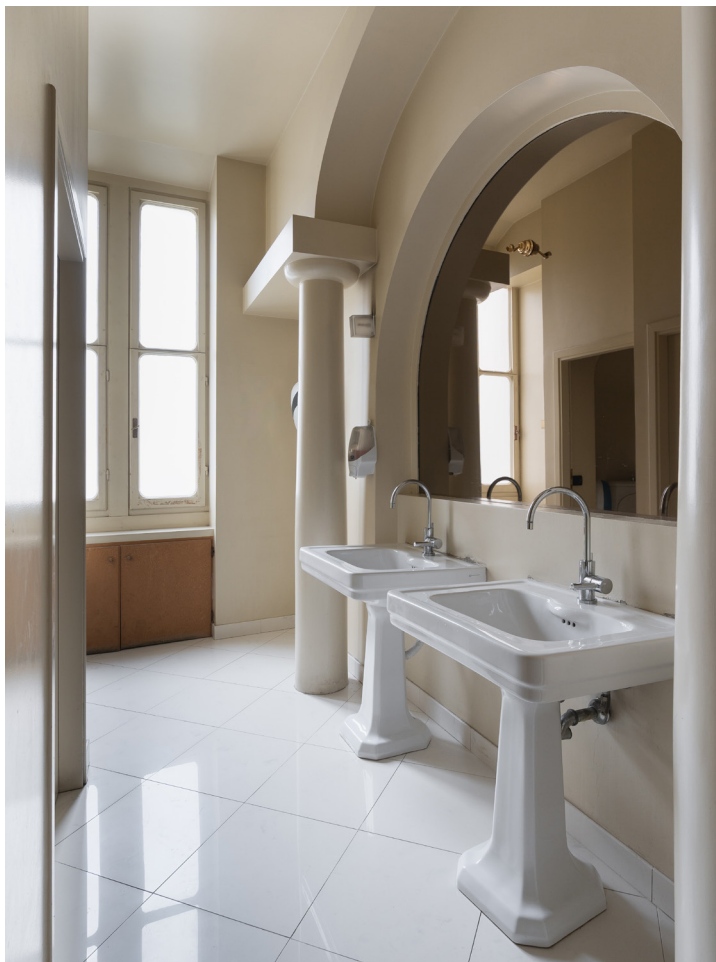
Uno dei bagni e un luminoso corridoio