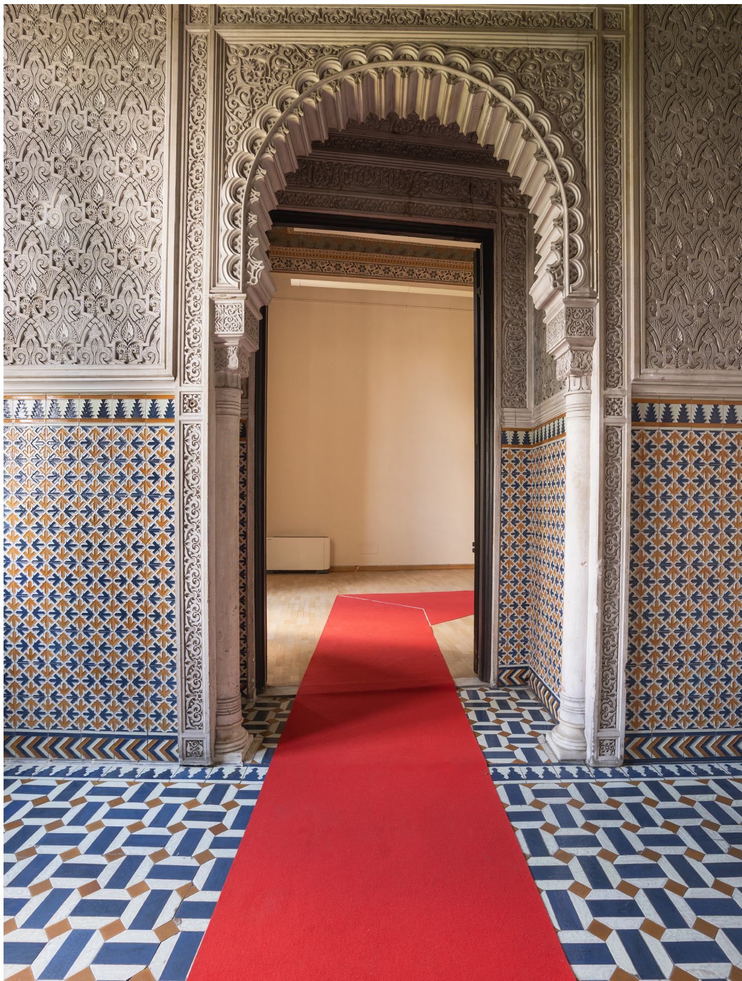
Un arco arabeggiante dialoga con la solennità del palazzo An Arabesque arch in dialogue with the solemnity of the palace