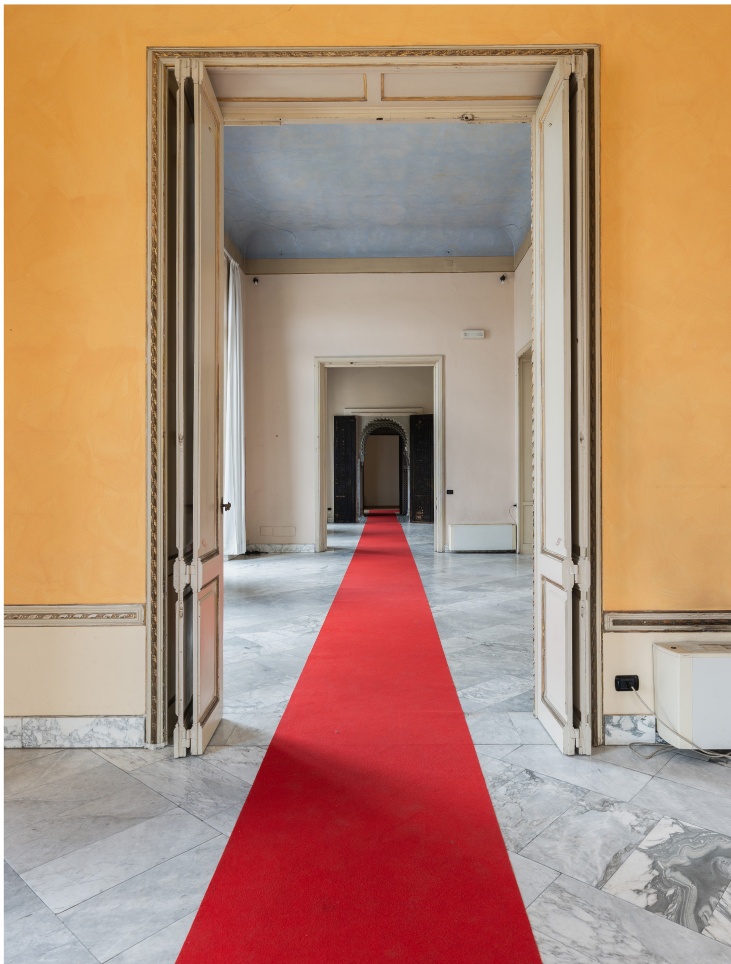
Passando in rassegna le sale si coglie l'eleganza e il prestigio della proprietà Passing through the rooms you get the elegance and prestige of the property