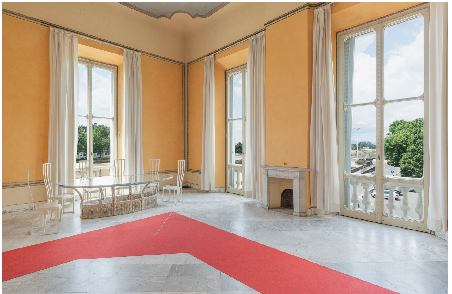
Lo straordinario salone inondato di luce con vista sull'Arno