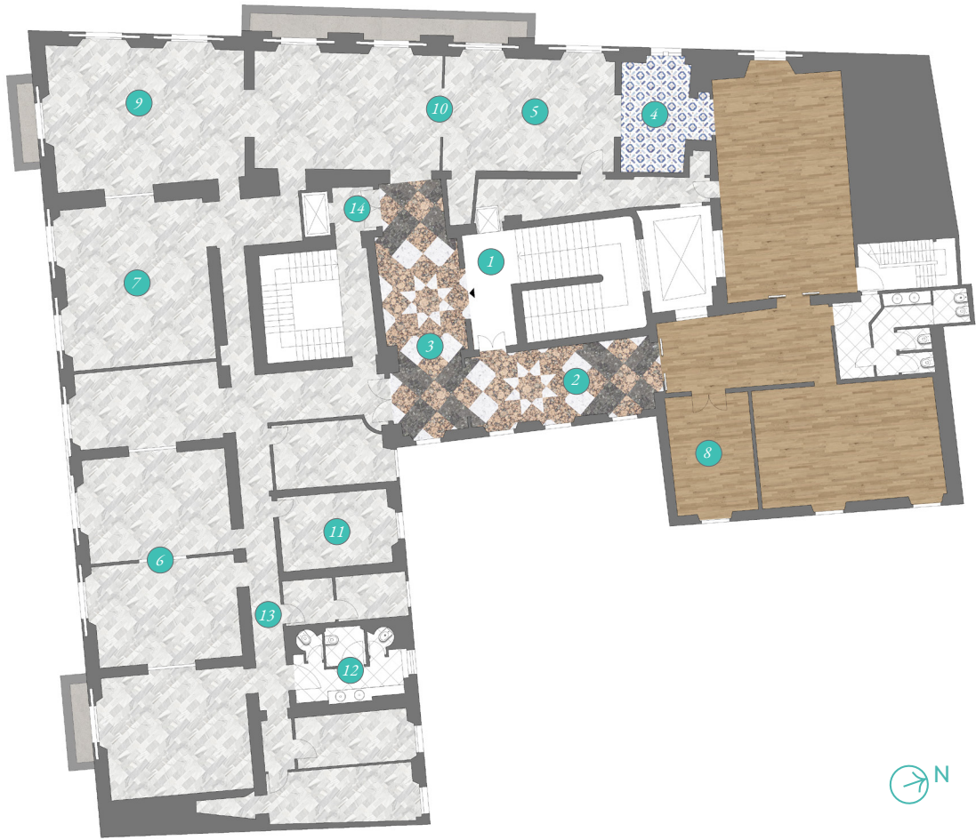
Piano primo First floor