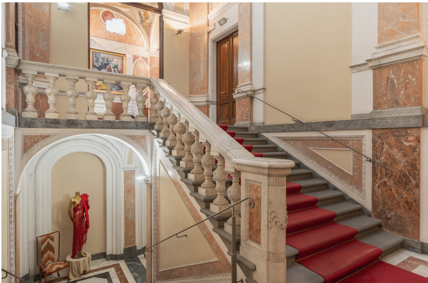
La maestosa scalinata che conduce al primo piano dove si sviluppa la proprietà