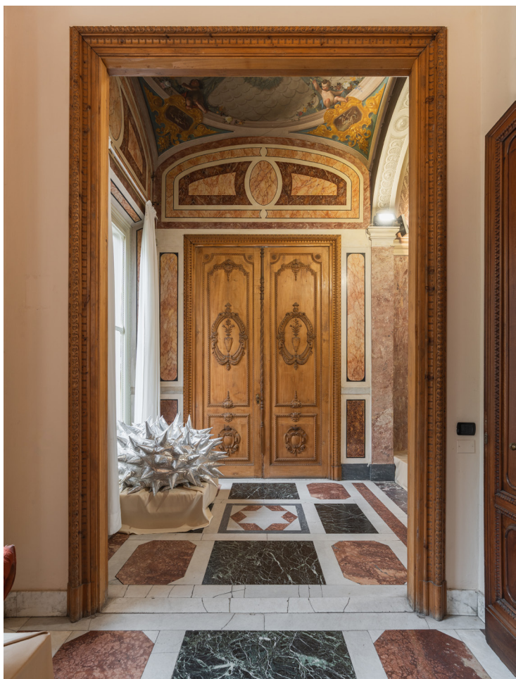
Dettagli dai magnificenti corridoi, nobiltà ad ogni passo