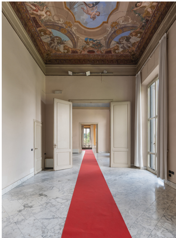
Suggestive "Moorish" details inserted in the nineteenth-century context