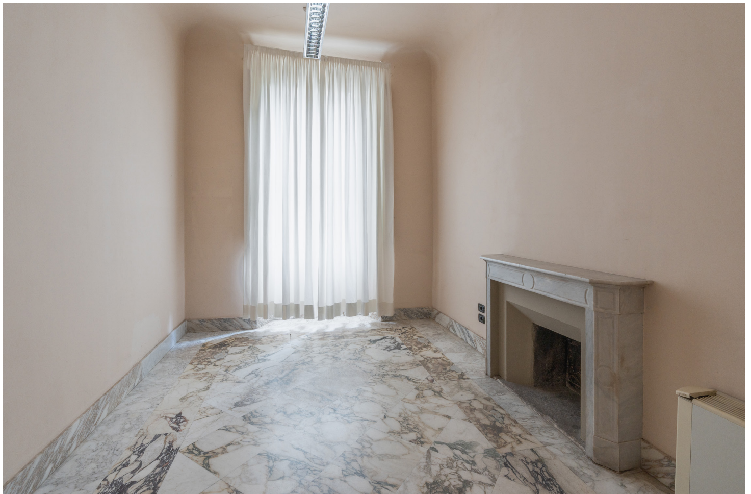
Uno spazio della residenza adibito ad ufficio