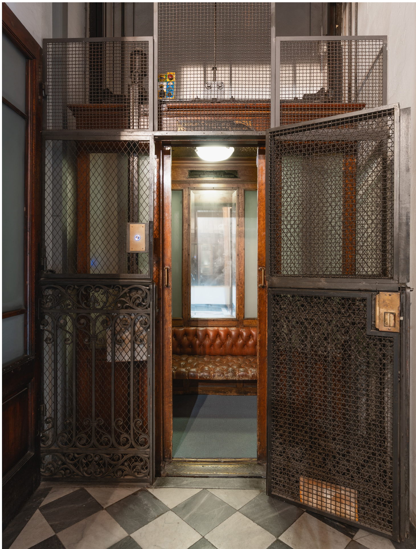
Ascensore d'epoca finemente conservato, dove l'eleganza del legno lucido incontra la leggerezza decorativa del ferro battuto Finely preserved vintage elevator, where the elegance of polished wood meets the decorative lightness of wrought iron