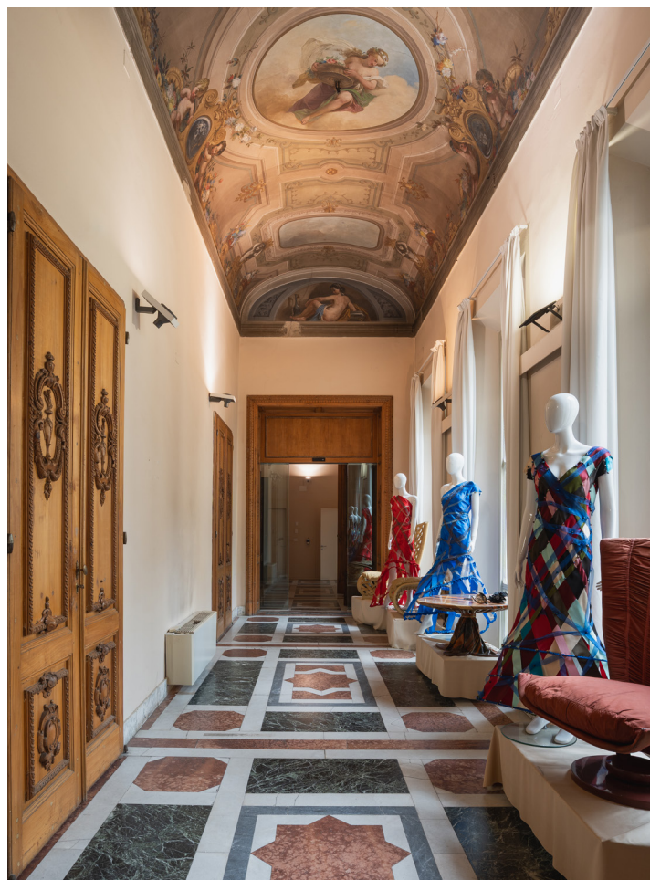
② Details from the magnificent corridors, nobility at every step