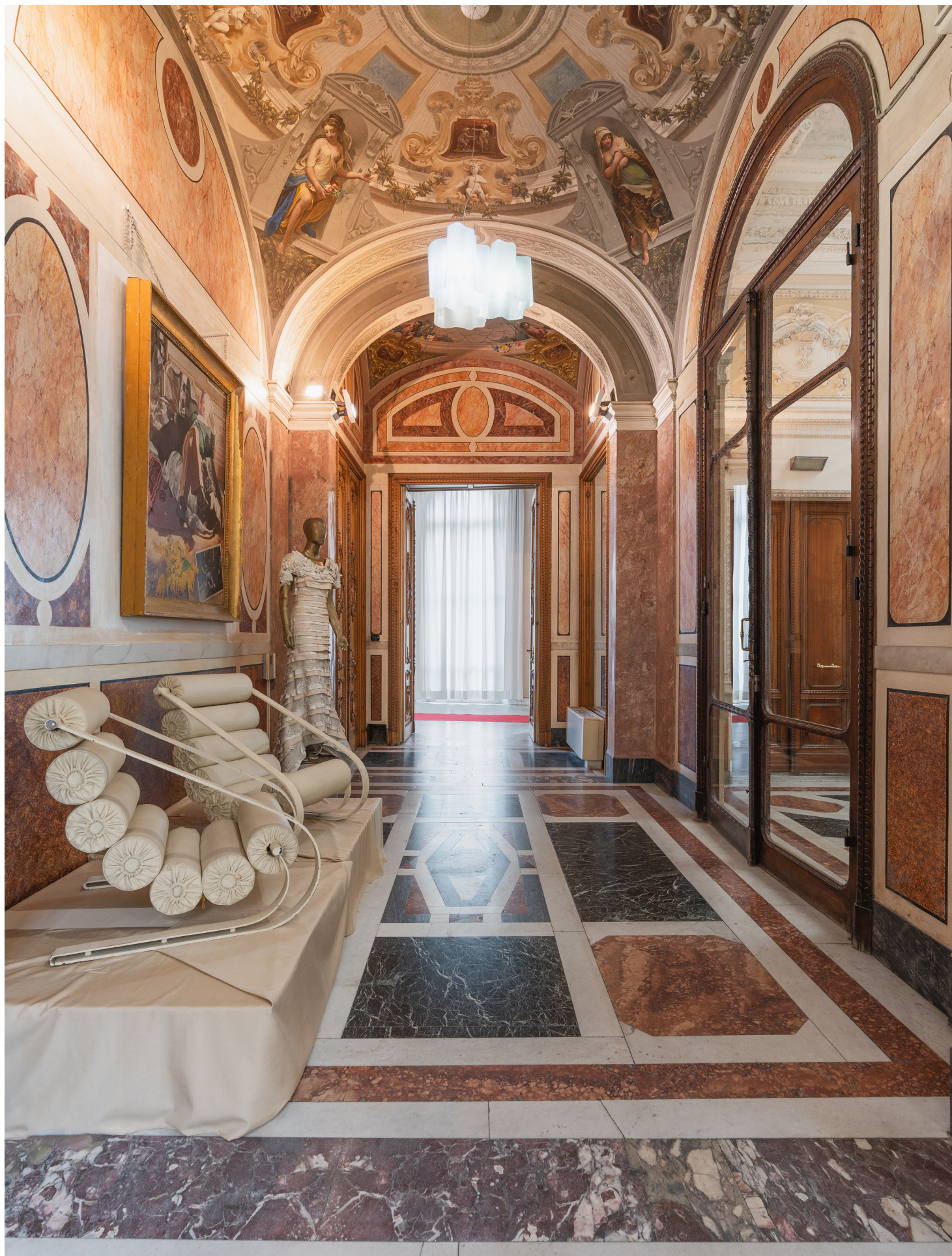
Le poltrone modello Balestra di Marzio Cecchi si integrano con meravigliosi affreschi e marmi The armchairs model Balestra by Marzio Cecchi are integrated with wonderful frescoes and marble