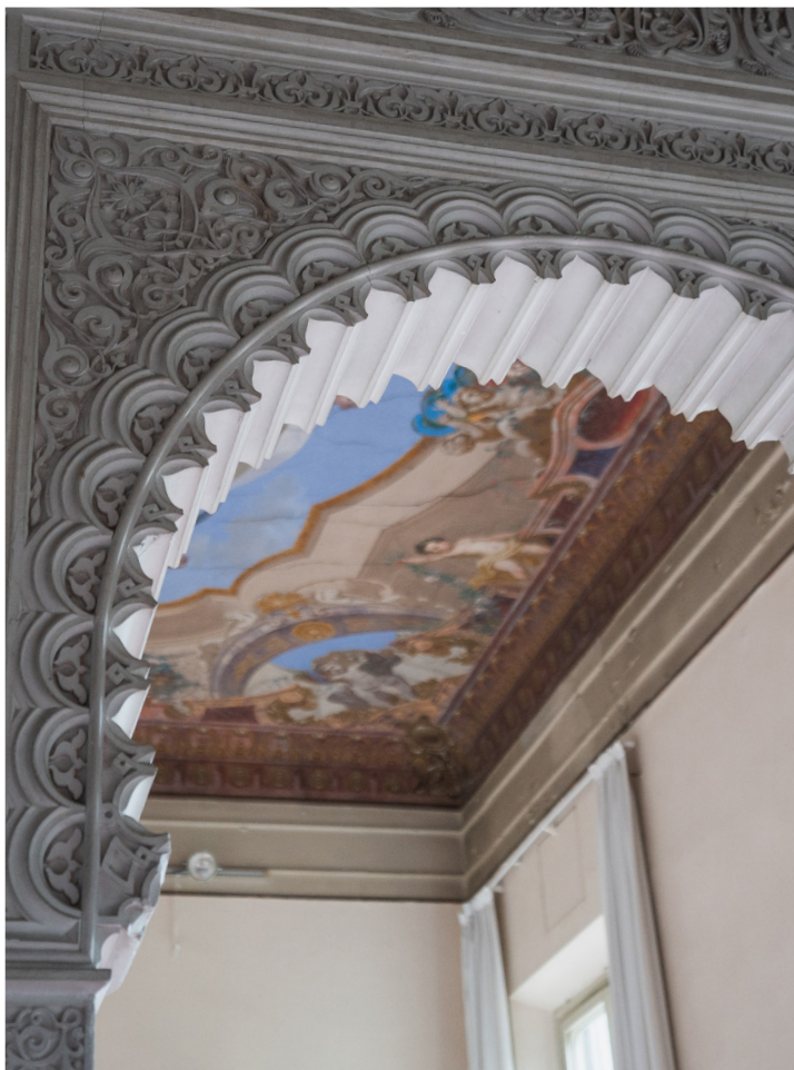
Suggestivi dettagli "moreschi" inseriti nel contesto Ottocentesco