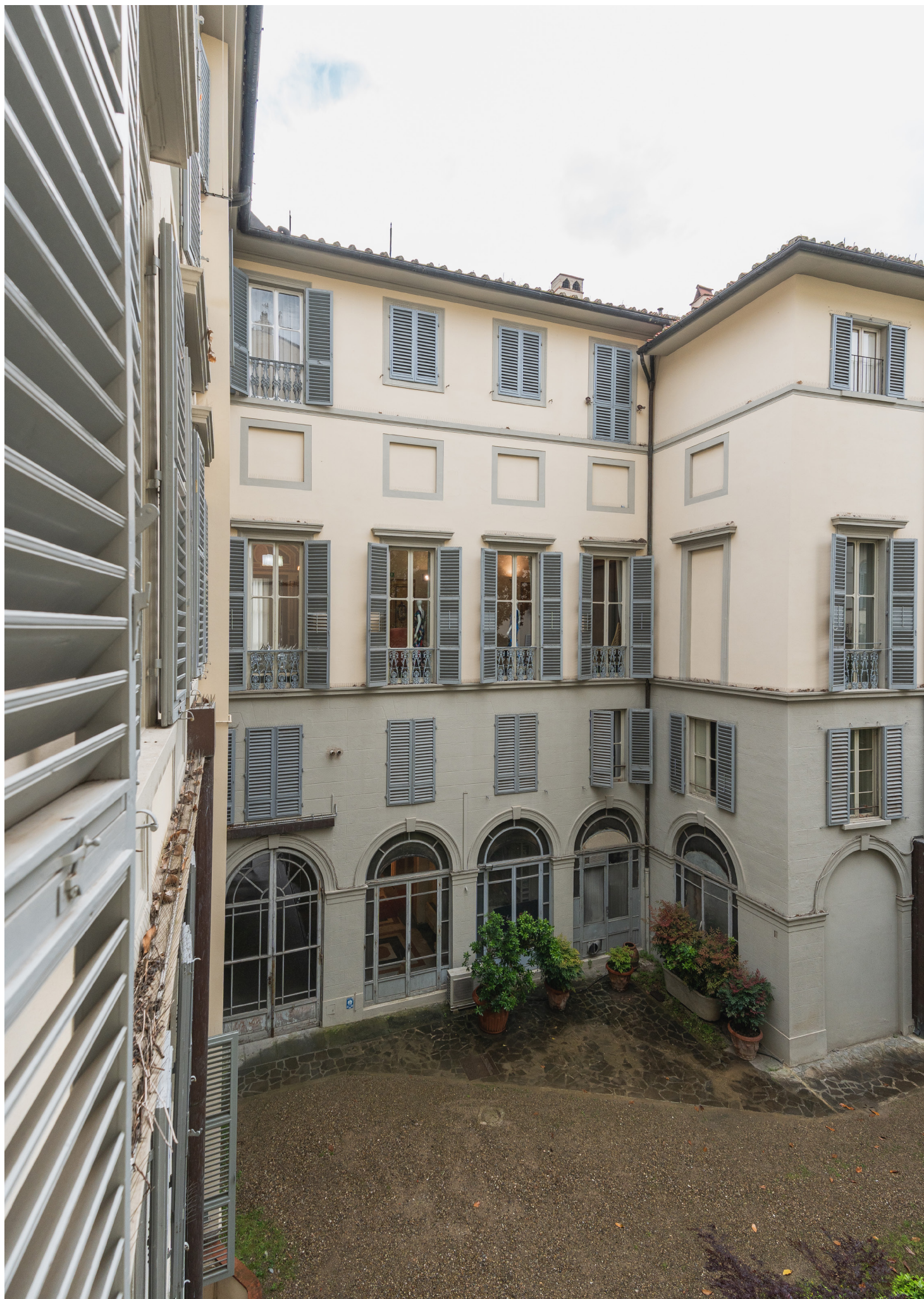
Il cortile interno di Palazzo Spiga rivela ulteriori elementi architettonici di pregio The inner courtyard of Palazzo Spiga reveals further valuable architectural elements