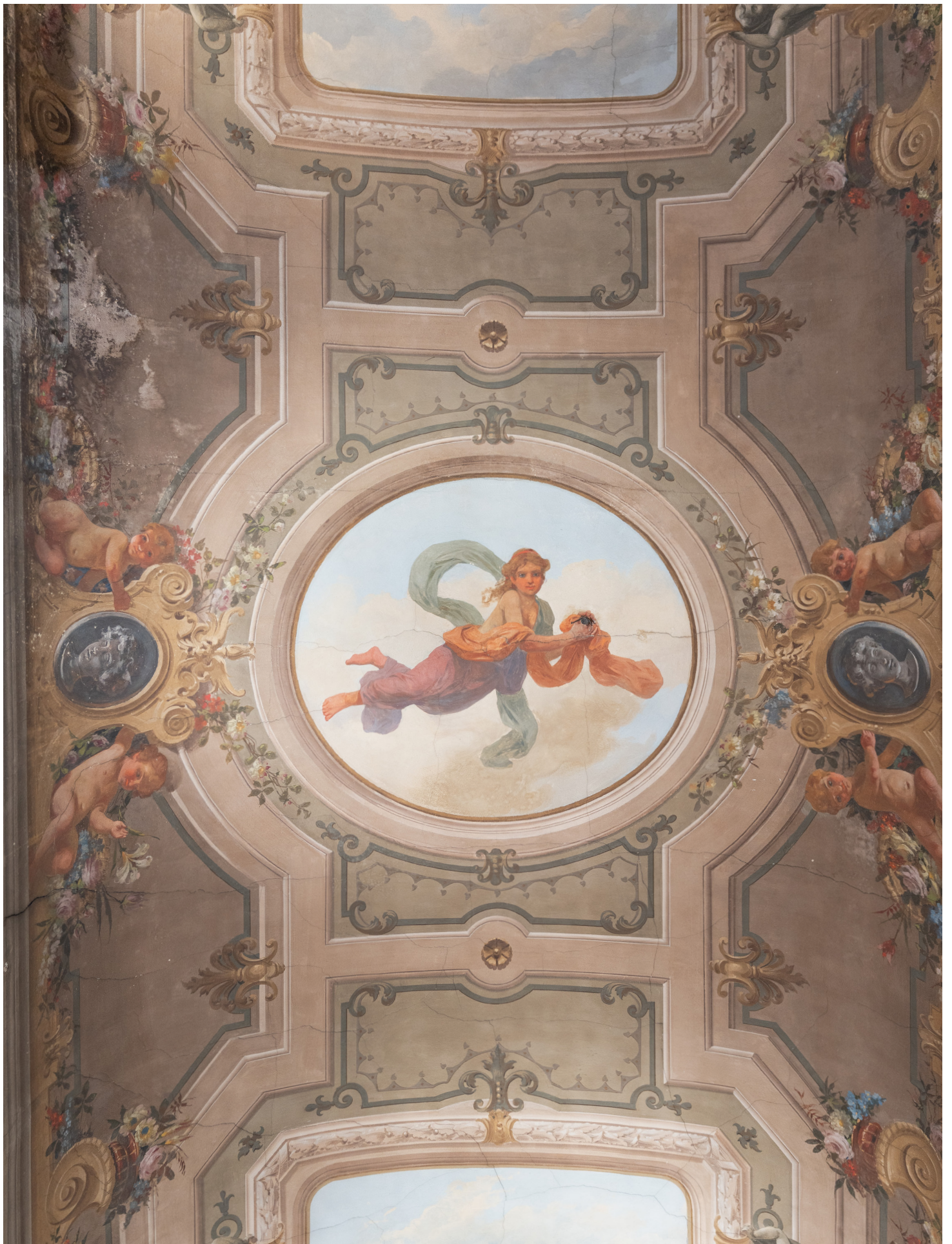
Un soffitto affrescato in stile barocco, con putti e ornamenti A Baroque frescoed ceiling, with putti and ornaments